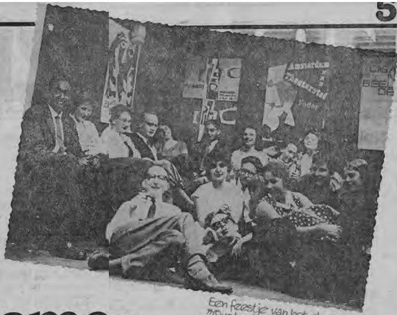
Een feestje van het d. puut "Quatre Bières" in de sociëteitskelder.