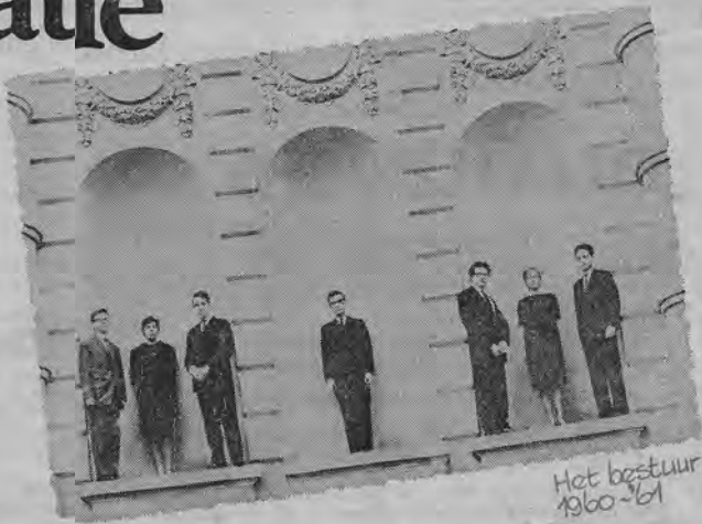
Het bestuur 1960-61

leden uit hun sociale en persoonlijke vooroordelen en in hun ontwikkeling tot vrije, zelfstandig denkende, bewust handelende mensen." Aldus de preambule tot de statuten en dat was ferm gesproken, maar wat kwam er in de praktijk van terecht? Er werd niet ontgroend, wel kennis gemaakt. Er waren geen bedienden, er was wel een