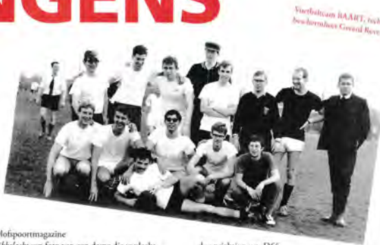
Vierhoede van BAART, rechts beschermheer Gerard Reve

daarbuiten. Gerard Reve wordt gevraagd als beschermheer en accepteert de uitnodiging. Als het BAART-team voertbalt is journalist Nico Scheepmaker scheidsrechter. Op een foto van dat voetbalteam staat de beschermheer ook, maar dan als coach. Nog bekendwerd het dispuut door de arrestatie van drie BAART-leden wegens belediging van prinses Beatrix. In de aanloop naar het huwelijk van Beatrix met de Duitser Claus von Amsberg plaats de redactie van