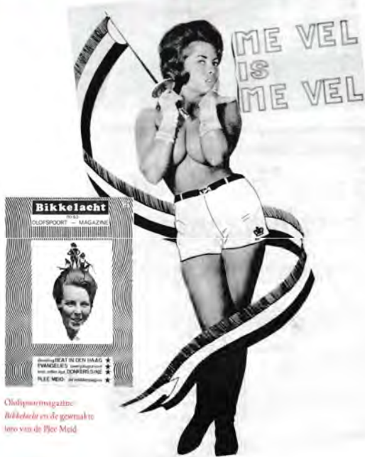
Olofspoortmagazine Bikkelacht en de goetmakle foto van de Plee Meid

beter. Dit jaar bestaat het dispuut 55 jaar en naar aanleiding daarvan is het herdenkingsboek verschenen. Dat is niet zo vreemd als je leest wie er in BAART zitten. De helft van de leden zou je kunnen rekenen tot het legioen Bekende Nederlanders, althans tot het